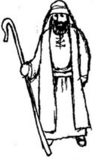
యాకోబుకు (ఇశ్రాయేలు) పన్నెండు మంది కుమారులు